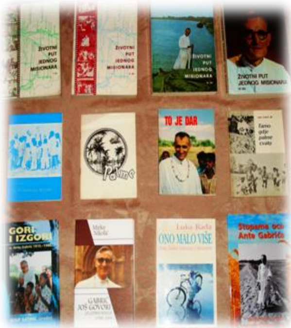
Naslovnice 12 objavljenih knjiga, oko 2.500 stranica koje opisuju život o. Ante