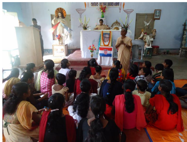
Liturgijska priprema za proslavu