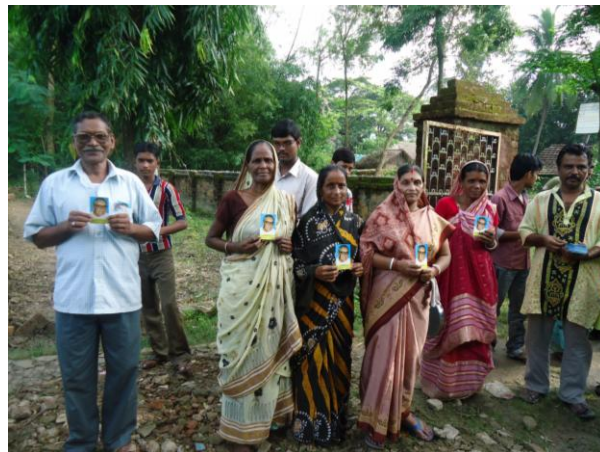
Uoči polaska na hodočašće u Maria Polly

(hrvatski iseljenici po svijetu). Imamo mnogo razloga nadati se pozitivnom ishodu i nastavku postupka, tj. proglašenju o. Gabrića najprije slugom Božjim, a potom bi slijedili i sljedeći koraci do same beatifikacije.